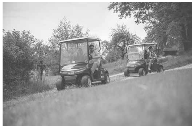
Bild: Interessierte beim Golf-Erlebnistag auf dem Kurzspielcenter des Golf-Club Hohenstaufen e.V. und bei der Golf-Cart-Fahrt über den Platz