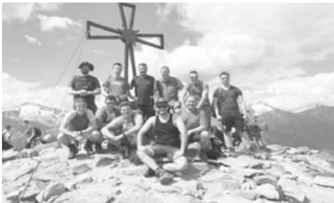
Bild: Gruppenbild auf dem Speikboden

Unser Dank gilt an dieser Stelle nochmals unserem Gasthof Mondschein für die hervorragende Aufnahme und Bewirtung.