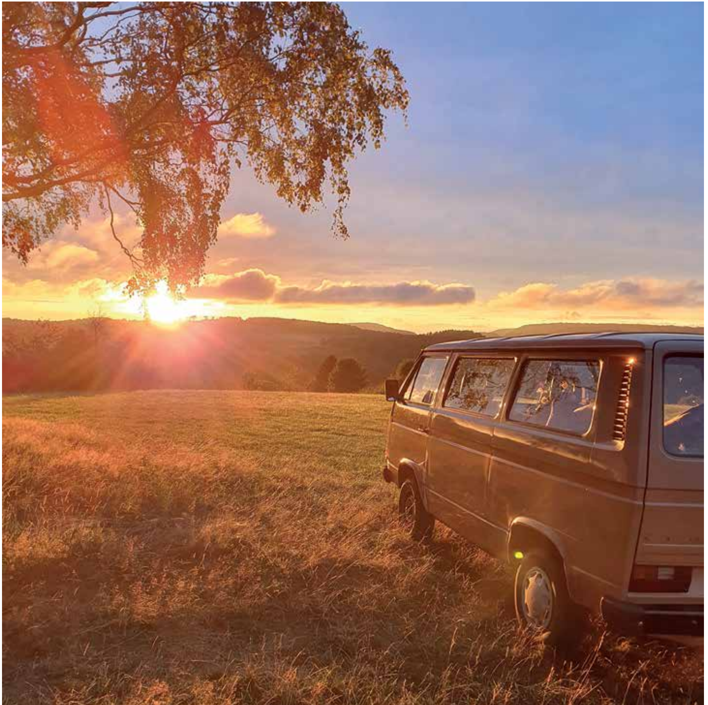
Spätsommerabend am Kriegsburren oberhalb Steighof

44. Jahrgang Freitag 25. September 2020 39