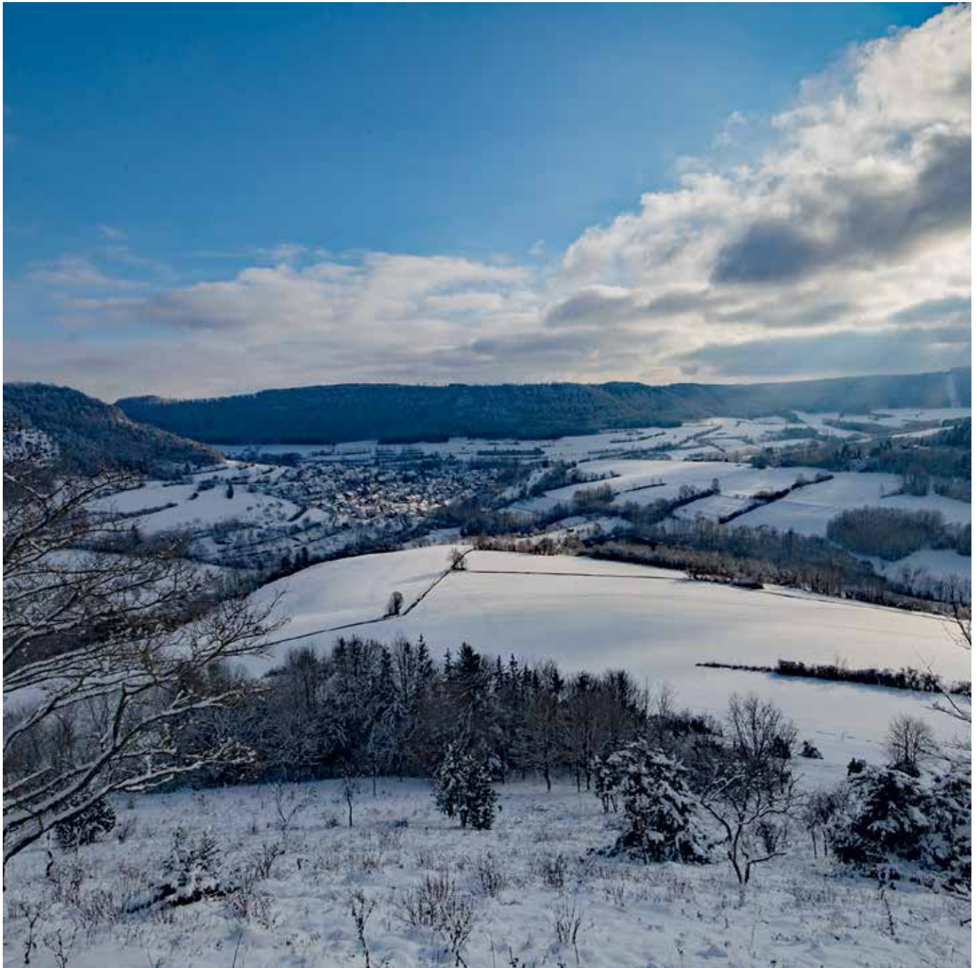
Blick vom Kuhberg auf Nenningen