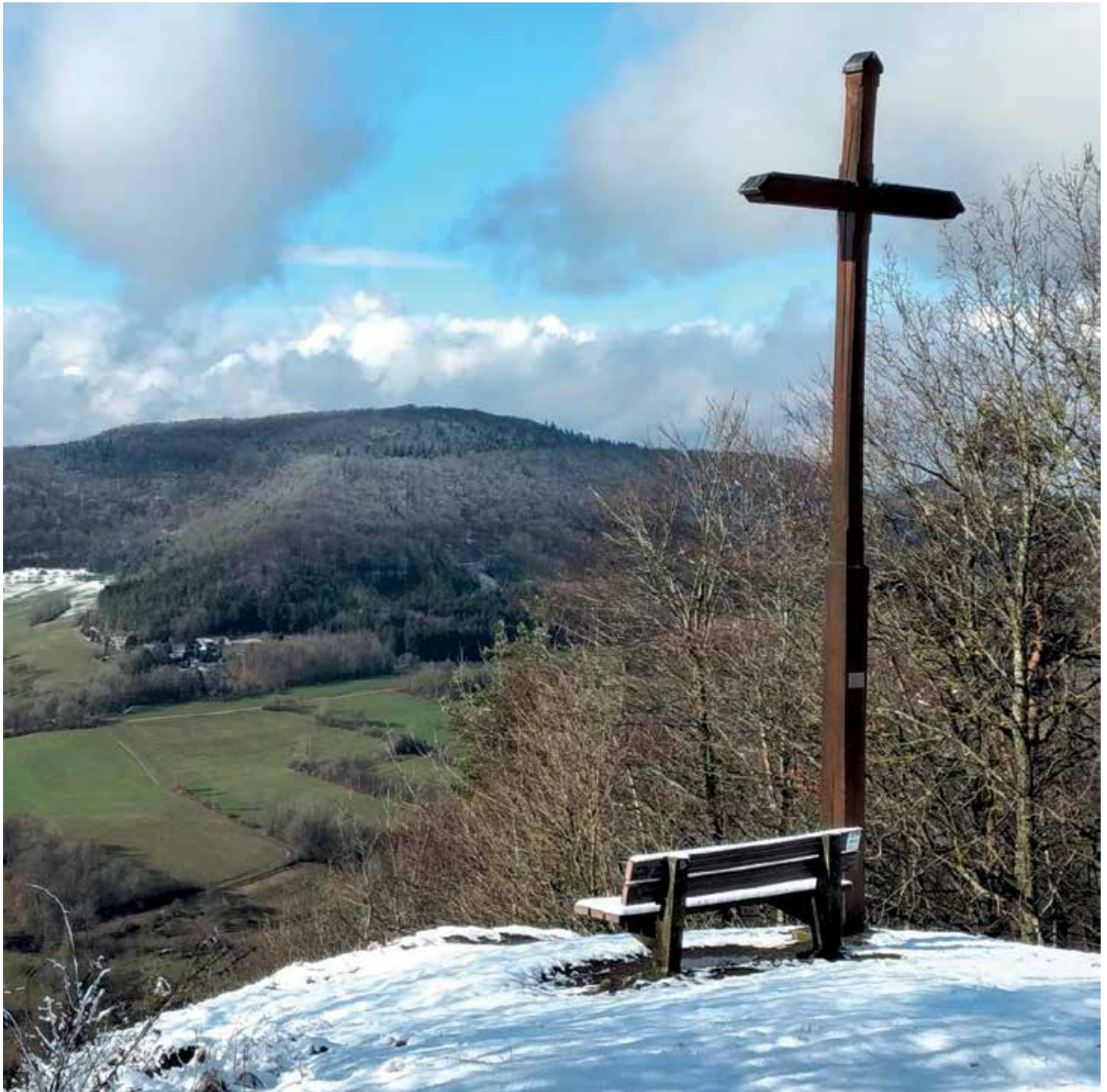
Auf dem Kreuzberg