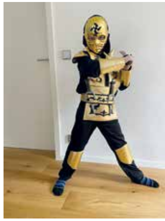
Prinz Basti I (goldener Ninja)