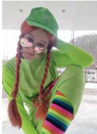
Königin Melina II (Greta Thunberg)

Sie haben die Ehre für ein ganzes Jahr sich Faschings-Prinz, Prinzessin, Königin von Weißenstein zu nennen. Sie erhielten die Krone, einen Fasnetsorden, eine Flasche Käspersessekt und eine kleine Süßigkeit Und dürfen beim nächsten Kinderfaschingsball ihre Kronen weitergeben.