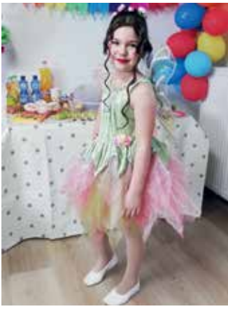
Prinzessin Enisa I (Feenkind)