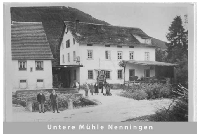
Untere Mühle Nenningen