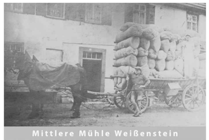
Mittlere Mühle Weißenstein