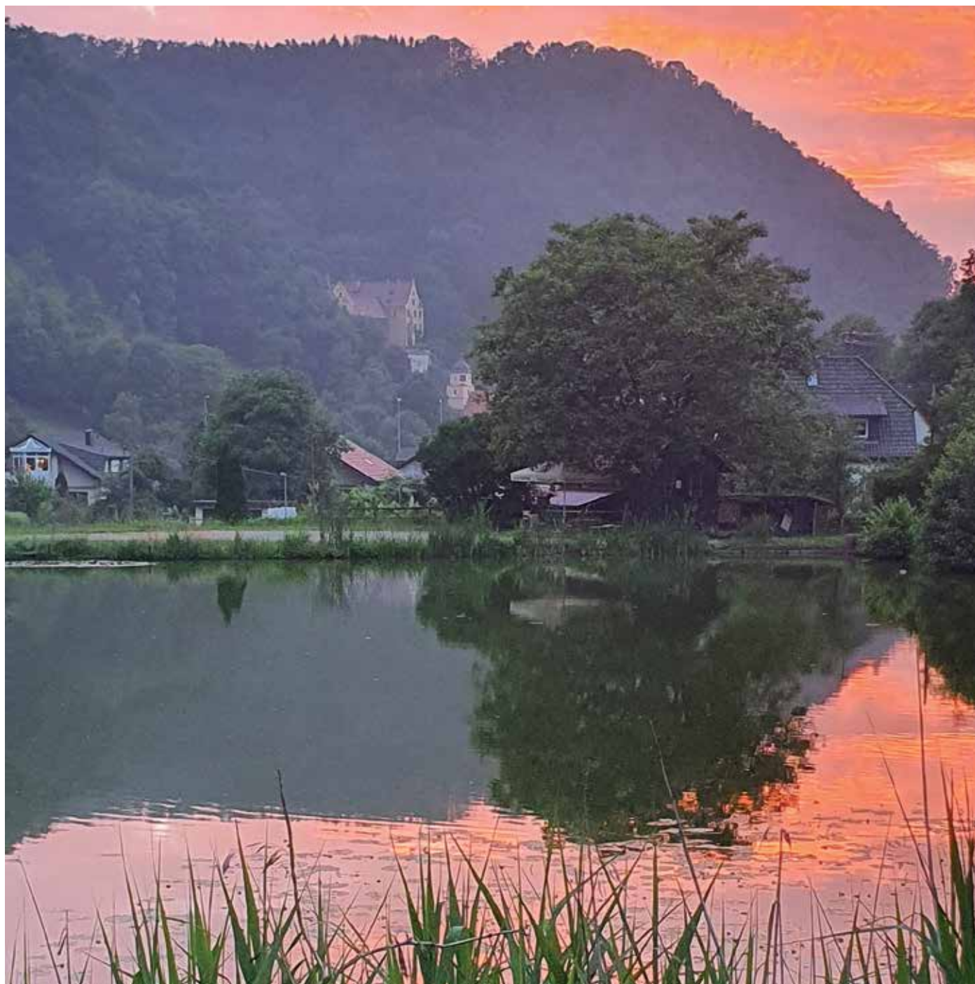
Abendstimmung am Weiher