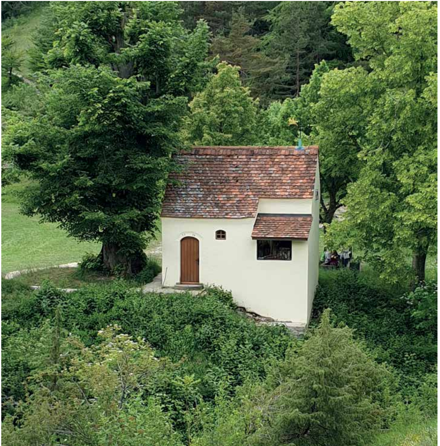
Die Reiterles Kapelle