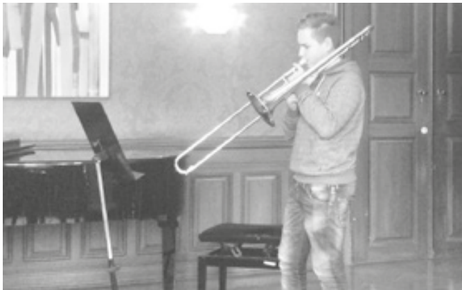
frei nach J.S. Bach „erschallt ihr Posaunen“