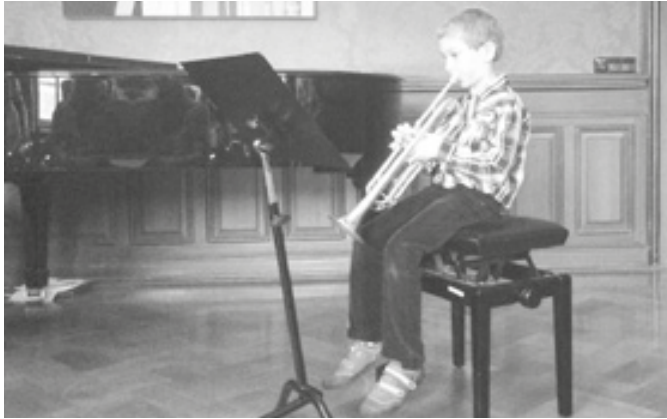
Der Jüngste blies schon kräftig in die Trompete