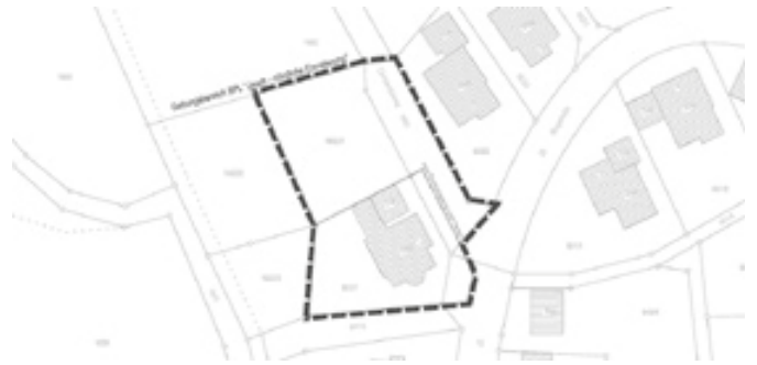
Lageplan Geltungsbereich Bebauungsplan und örtliche Bauvorschriften „Jauch, nördliche Erweiterung“

Der Geltungsbereich der Satzung umfasst die Flurstücke 1662/1 und 663/1 sowie eine Teilfläche des Flurstücks 1663 (Christentalweg). Die genaue Abgrenzung ergibt sich aus dem beigefügten Lageplan: